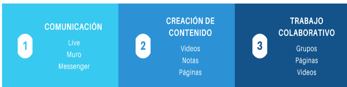
Figura 1. Aplicaciones de Facebook de acuerdo a su utilidad.

Al analizar los tipos de aplicaciones que dispone Facebook, estas pueden clasificarse en aplicaciones de comunicación, de creación de contenido y de trabajo colaborativo, tal como se muestra en la figura 1.